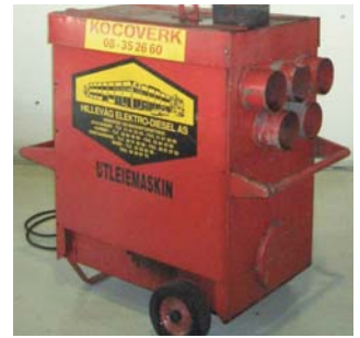
Byggvarmere - diesel og elektriske 1-300 kW