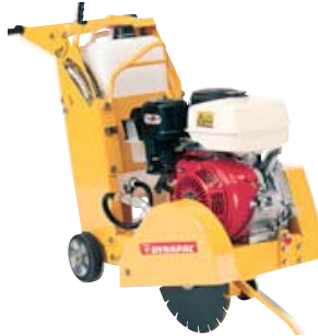
Asfalt- og betongsager