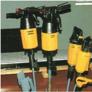
Atlas Copco - bor-/meiselmaskiner