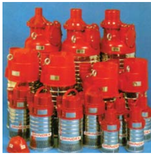
Små og store lense-pumper