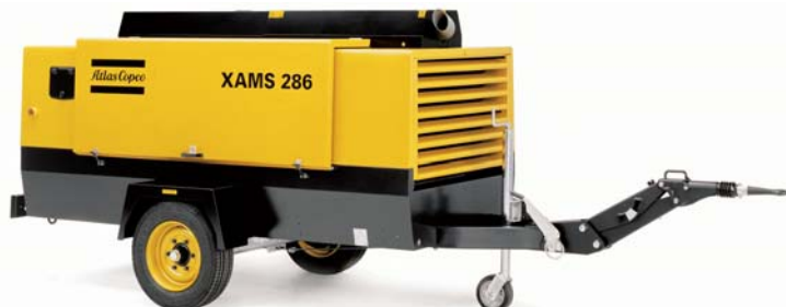
Kompressorer – elektrisk-/dieseldrevne

Kundekretsen til Hillevåg Elektro-Diesel er svært variert – fra en-manns foretak som rørleggere o.l. til de største olje- og oljerelaterte selskapene. Bedriften satser derfor på stadig utvikling og fornyelse – ikke bare av produktspekteret, men også av kundebasen. Et viktig konkurransefortrinn er gjennomført kvalitet og sikkerhet i alle ledd – det gir fornøyde kunder.