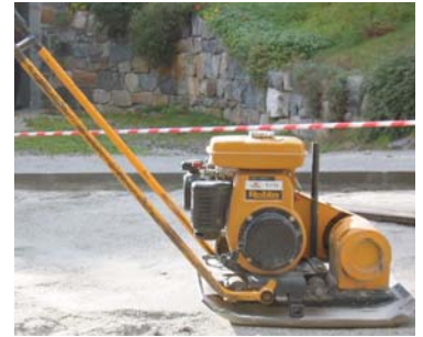
Dynapac stampvibrator 15-100 kg